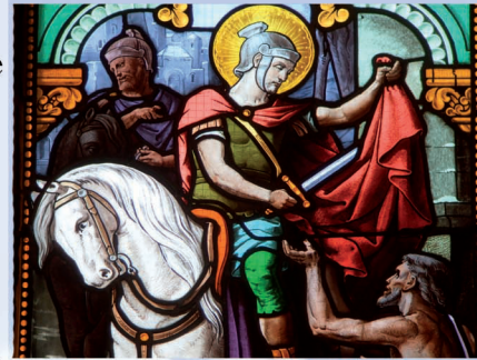
vitrail église de Louerre

Martin, l'homme du partage, prend son épée, divise sa chlamyde en deux, en donne un morceau au pauvre et se rhabille avec le reste. La nuit suivante, le Christ lui apparaît dans son sommeil, vêtu de la moitié de la chlamyde donnée au pauvre. Il l'entend déclarer à la foule des anges : « Martin, qui n'est encore que catéchumène, m'a couvert de ce vêtement ». C'est sans doute cette vision qui va hâter son baptême. Sulpice Sévère mentionne ensuite que Martin a continué à servir l'armée pendant deux ans, avant de demander son congé à l'empereur Julien.