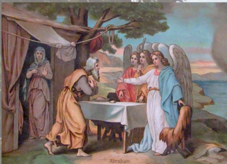
L'hospitalité d'Abraham (Genèse 18) - catéchisme en images de Coutures

de la lettre de saint Paul : 1 Corinthiens 13, 1 « J'aurais beau parler toutes les langues de la terre et du ciel, si je n'ai pas la charité, s'il me manque l'amour, je ne suis qu'un cuivre qui résonne, une cymbale retentissante. »