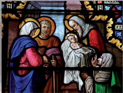
vitrail église de Chemellier

Luc 2, 22 : « les parents de Jésus le portèrent à Jérusalem pour le présenter au Seigneur »