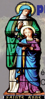
église de Coutures

Luc 2, 48 : « En le voyant, ses parents furent stupéfaits, et sa mère lui dit : « Mon enfant, pourquoi nous as-tu fait cela ? Vois comme nous avons souffert en te cherchant, ton père et moi ! »