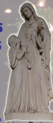
ici aux Rosiers

Anne est souvent représentée, apprenant à lire à sa fille Marie. Vous remarquerez que les statuaires mettent dans les mains d'Anne, parchemins et même livres... l'éveil était sans doute oral.